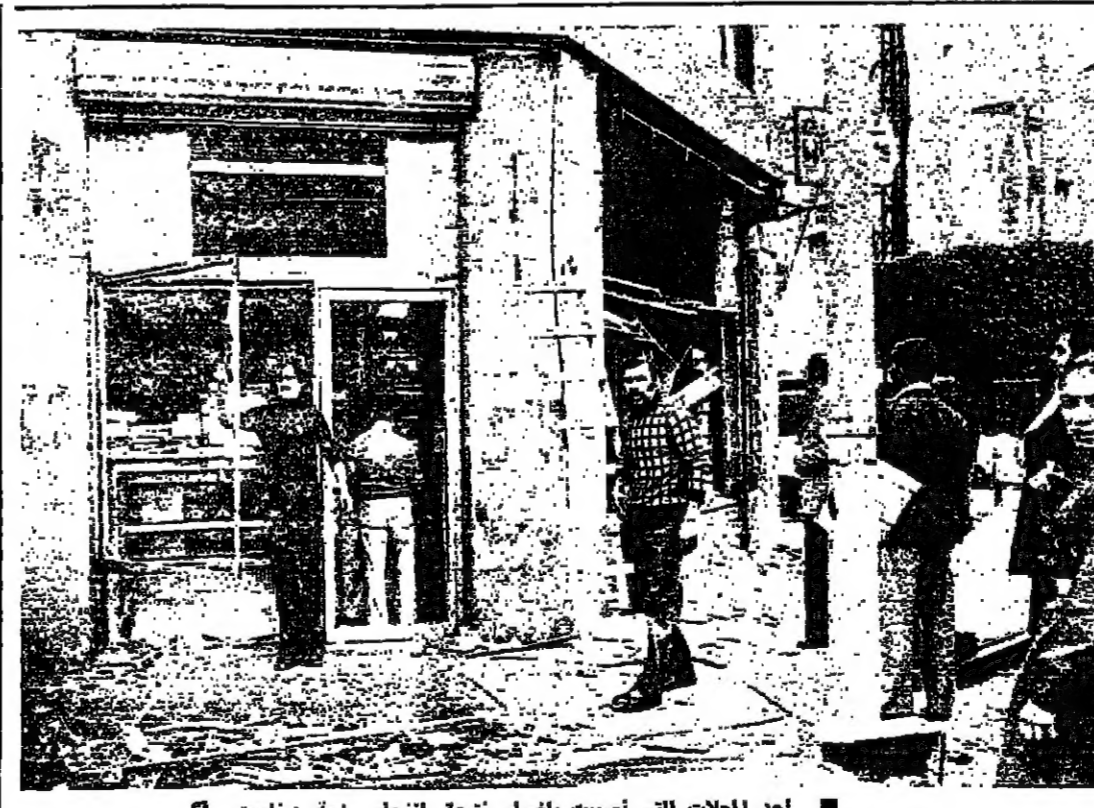
أحد المجلات التي أصيبت باضرار نتيجة انفجار رزمة ديناميت